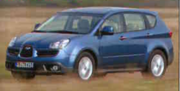
Subaru B9 Tribeca