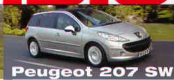
Peugeot 207 SW