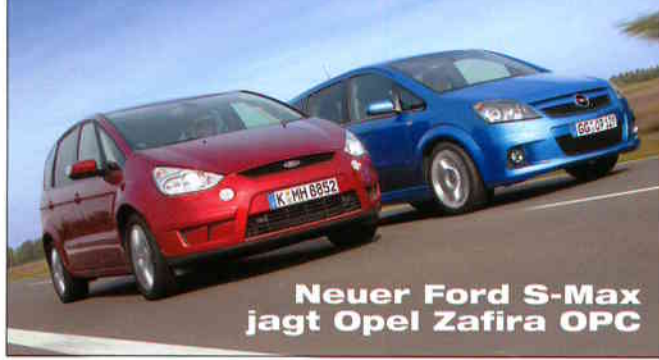
Neuer Ford S-Max jagt Opel Zafira OPC