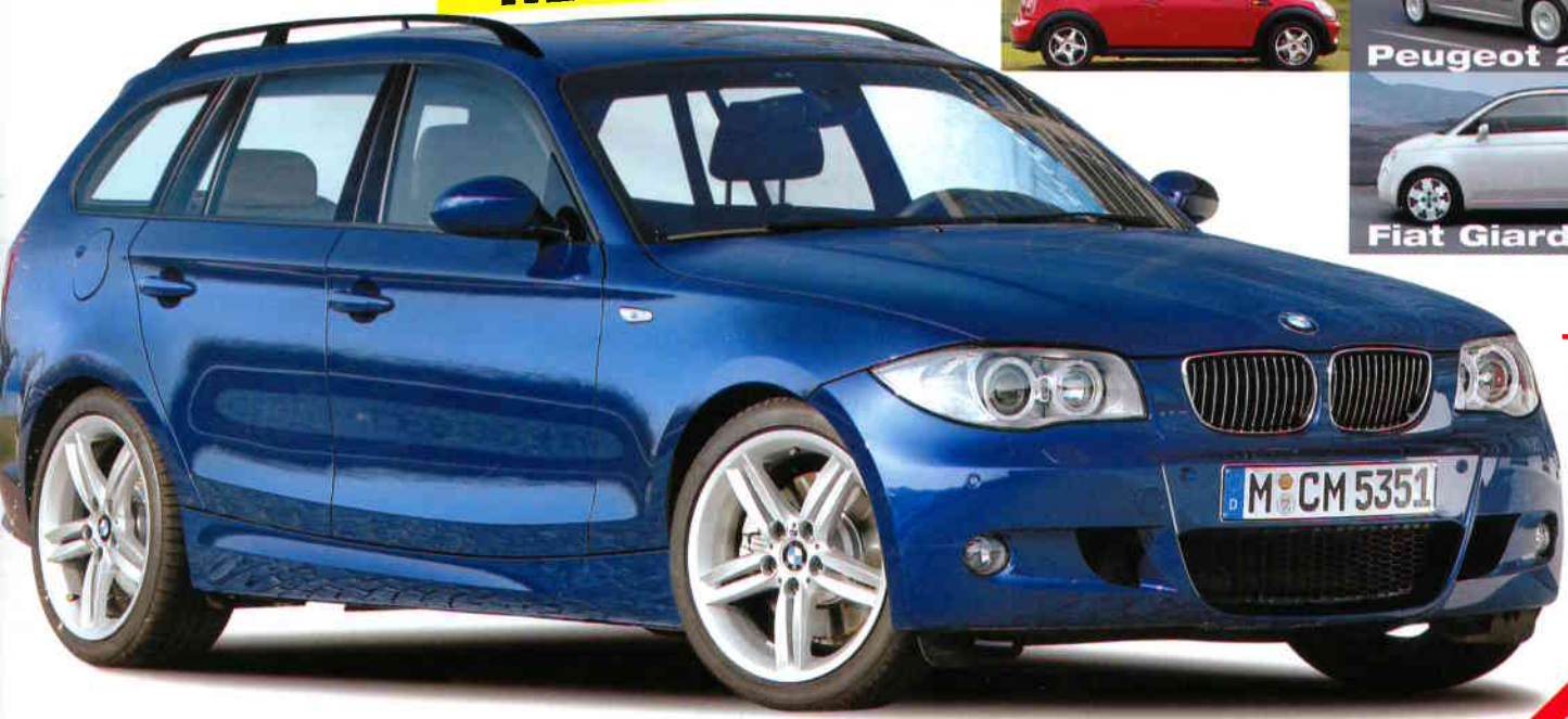
BMW 1er Touring

Tuning Opel Astra von Irmischer & Steinmetz