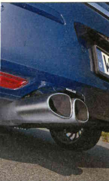
Sehr beliebt Nachschalldämpfer mit verchromten Ausgängen