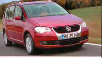
VW Touran Facelift