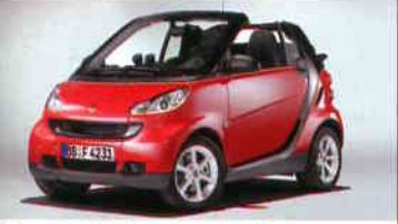
Smart Fortwo II