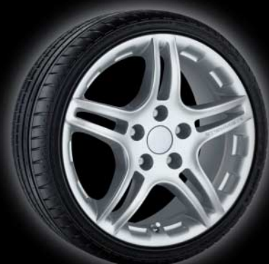
STEINMETZ ST3 Leichtmetallfelge ST3 light alloy wheel