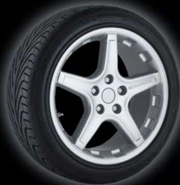
STEINMETZ ST1 Leichtmetallfelge ST1 light alloy wheel

7,0J x 16" offset 39 7,5J x 17" offset 38