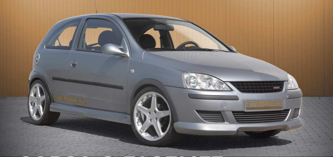
CORSA C FACELIFT