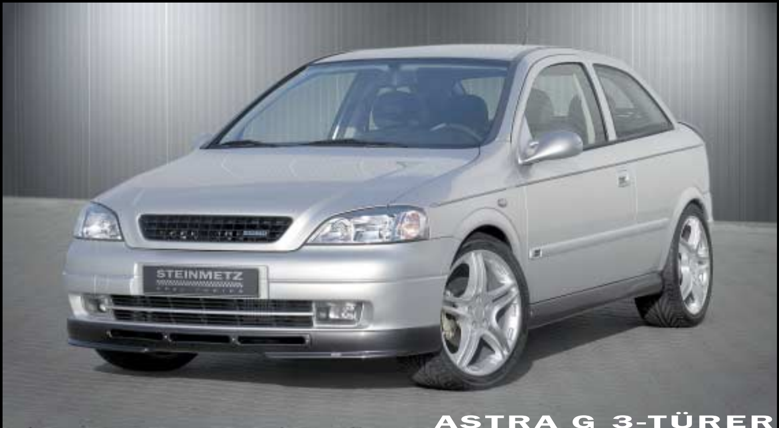
ASTRA G 3-TÜRER 3-DOOR

Sportlich, praktisch, individuell: Diese drei Attribute beschreiben am treffendsten den Opel Astra nach der Veredelung durch STEINMETZ Opel-Tuning.