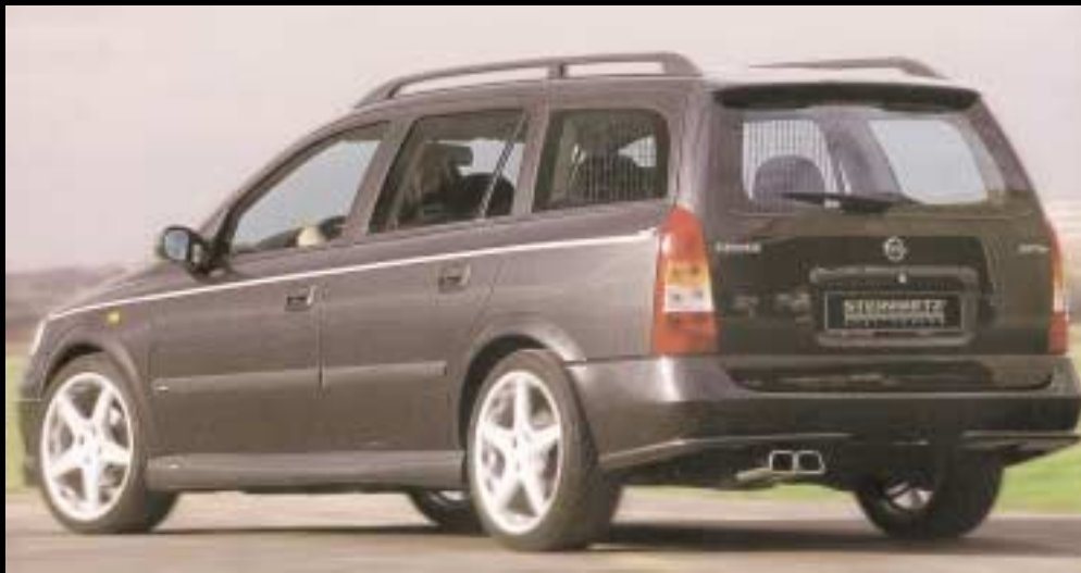
ASTRA G CARAVAN

Der Astra ist das perfekte Auto für das Geschäft wie für Familie, Sport und Freizeit. Jede Menge Lade- und Stauflächen lassen sich z.B. beim STEINMETZ Astra Caravan ganz leicht mit jeder Menge Fahrspaß kombinieren. So wird dieses Fahrzeug nicht nur zum idealen Gefährt für Menschen, die Ihre Freizeit gerne aktiv gestalten, sondern selbst zum ambitionierten Sportgerät.