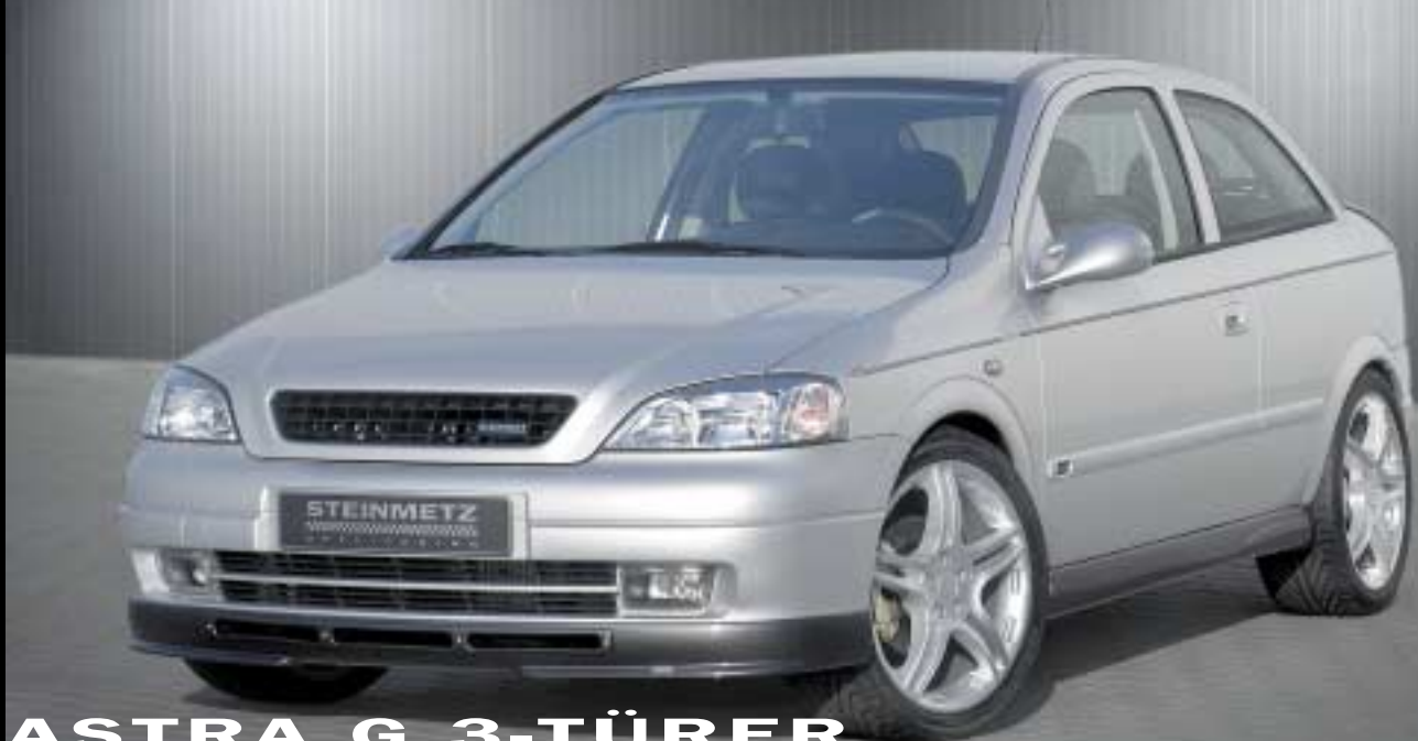
ASTRA G 3-TÜRER 3-DOOR